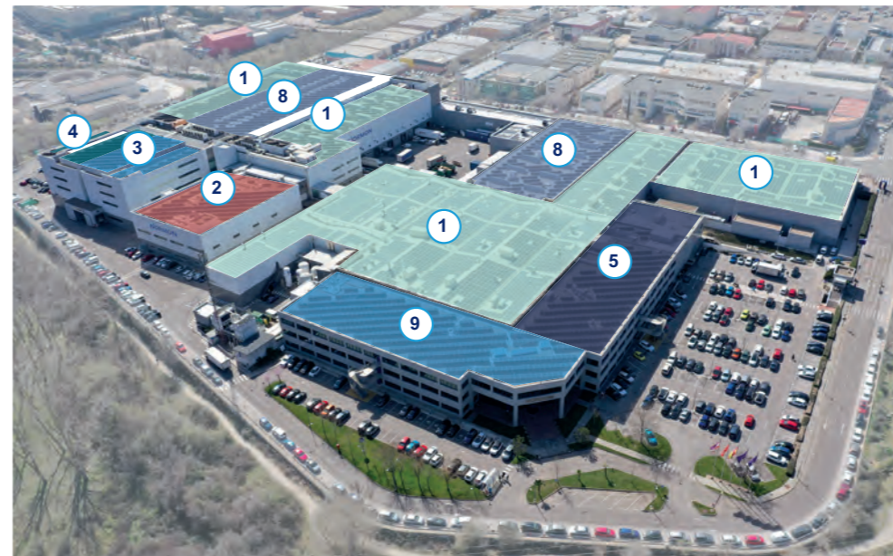
Ronda de Valdecarrizo

Situado en la zona norte de Madrid, en Tres Cantos, es sin duda uno de los más modernos laboratorios de fabricación de medicamentos en Europa .