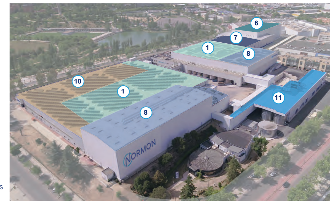
Avenida de los Artesanos